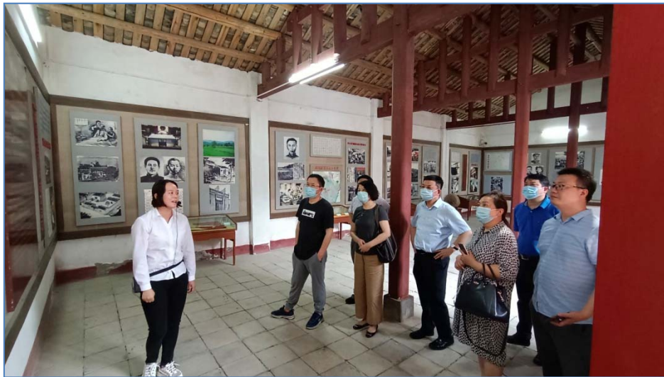
（专家组成员参观乘马会馆）