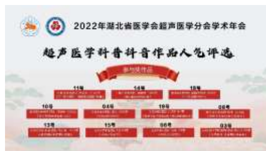
超声医学科普抖音作品最具人气奖及参与奖获奖名单