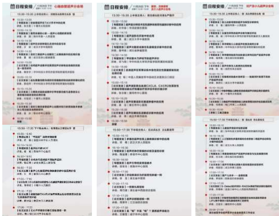
心脑血管分会场、腹部浅表器官及介入超声分会场、妇产及小儿超声分会场日程安排

专题汇报及论文发言分为三个分会场进行：心脑血管分会场、腹部浅表器官及介入超声分会场、妇产及小儿超声分会场。专题汇报邀请了省内各大医院超声科的专家学者开展了 21 场学术讲座，内容涵盖了超声各亚专业疾病的诊断与治疗，为与会的超声同仁们传授实践经验，分享体会心得。而论文发言则是邀请了省内的中坚力量、后起之秀开展了 24 场学术发言，展现了新时代青年医师的积极风貌及过硬的业务能力。